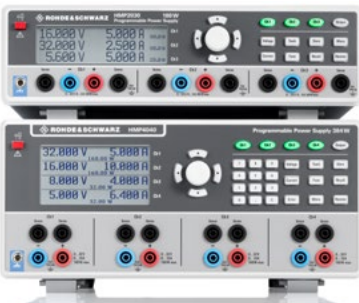
R&S®HMP2030 Drei-Kanal-Netzgerät und R&S®HMP4040 Vier-Kanal-Netzgerät