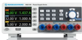
Netzgerät der Serie R&S®NGE100B