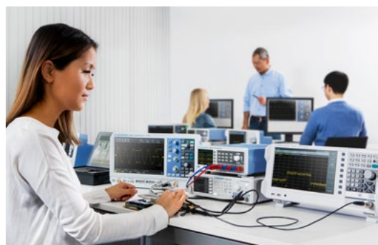
Zugeschnitten auf den Einsatz im Unterricht sowie in Laboren und Systemracks

Wenn ungeübte Studenten ihre ersten Erfahrungen in der praktischen Arbeit mit elektronischen Geräten sammeln, kann so manches passieren – die Ausgänge der Netzgeräte der Serie R&S®NGE100B sind jedoch kurzschlussfest und daher vor Schäden geschützt.